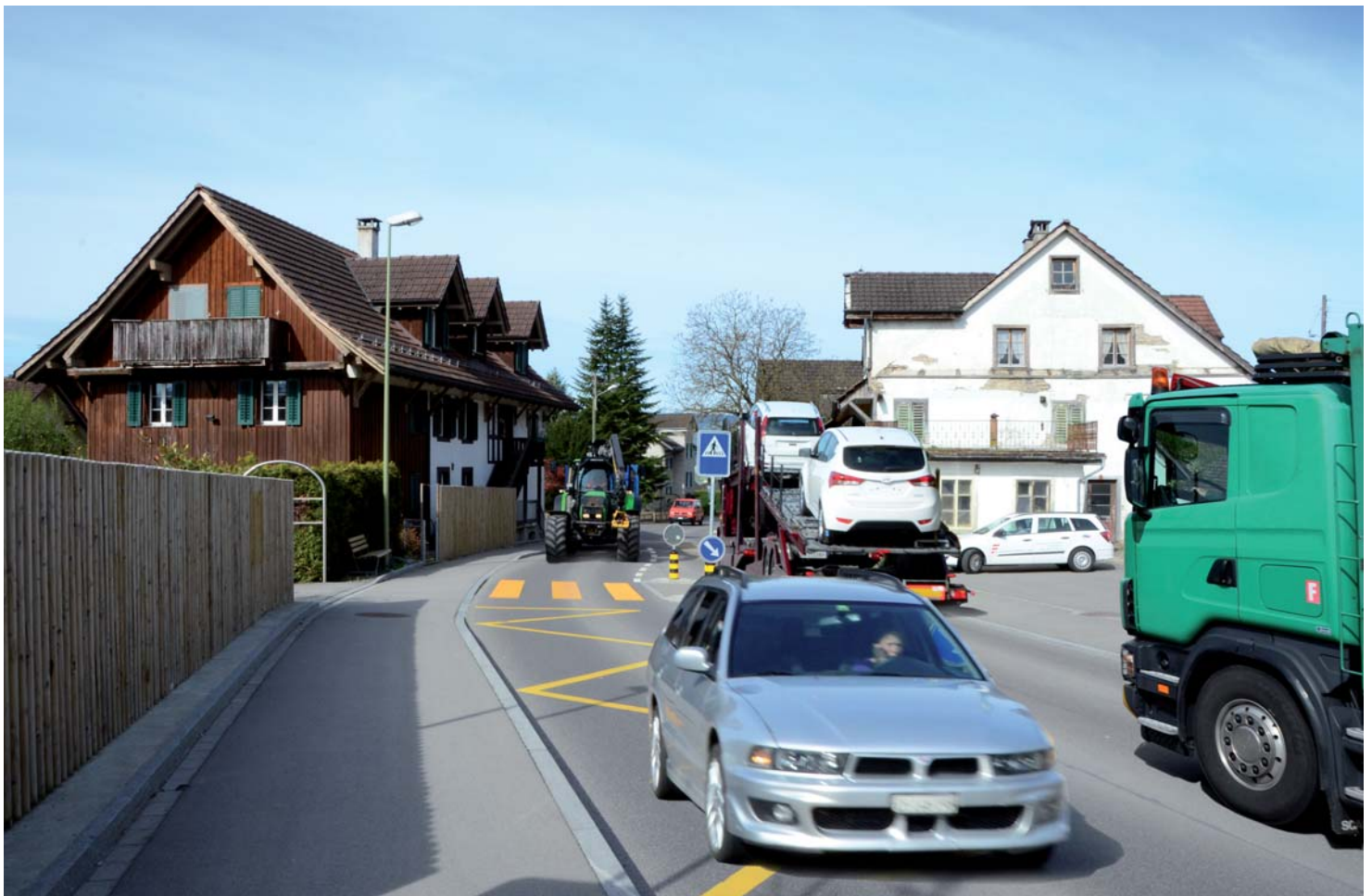
Ortskern Bickwil: Situation heute

Das Projekt enthält verschiedene flankierende Massnahmen (FLAMA), welche die Entlastung in den Ortsdurchfahrten in Obfel-